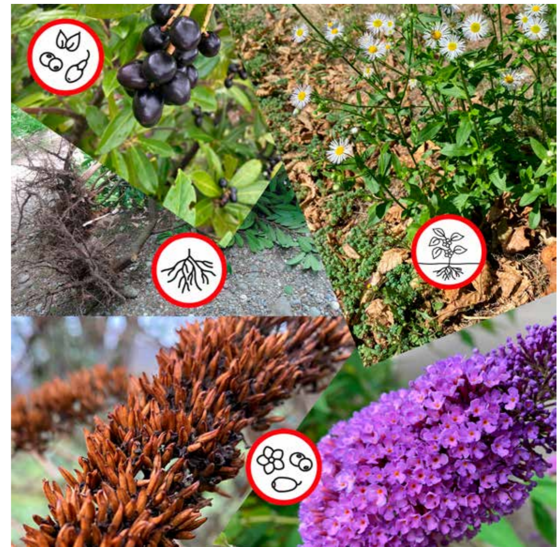
Arten mit Icons: Kirschlorbeer (links oben), Einjähriges Berufkraut (rechts oben) und Sommerflieder (unten)

Invasive Neophyten verdrängen einheimische Pflanzen, die Insekten als Nahrung dienen, beschädigen Infrastruktur wie Bahndämme, Strassen oder Uferbefestigungen und können sogar die Gesundheit gefährden. Deshalb ist es nötig, ihre Weiterverbreitung einzudämmen. Wir danken Ihnen herzlich für Ihre Mithilfe!