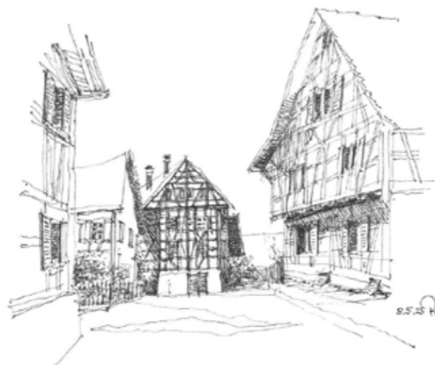
Oberdorf neben dem Schützer